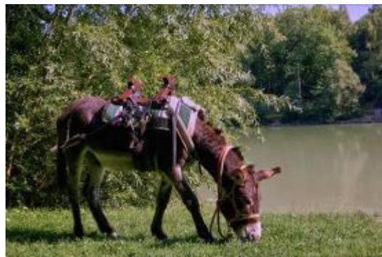
Nous nous rattraperons en 2015.

Cette année, nous n'avons pas pu faire notre sortie spéciale Nointellois pour des raisons indépendantes de notre volonté et nous en sommes désolés.