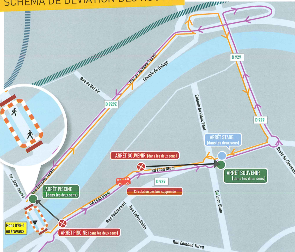
SCHÉMA DE DÉVIATION DES ROUTES

La déviation de la circulation s'effectuera par le pont de la RD929. L'itinéraire empruntera les rues du Docteur-Jacques-Touati, chemin Pavé, la route de Clermont et boulevard Léon-Blum.